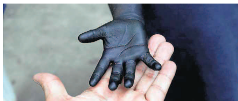
Choque cultural. Criança indígena mostra mão pintada em Tabatinga