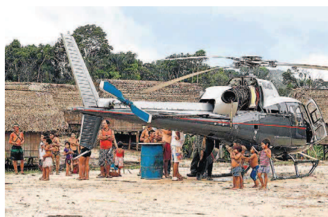
Tragédia. Helicóptero que atendia aldeias caiu em maio: cinco mortos