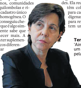
Tereza Campello. ‘Ainda temos um longo caminho pela frente’

A ministra decidiu retirar a exigência no cadastro do endereço fixo para atender ciganos e outros povos nômades. Ela reclama que prefeitos têm colocado empecilhos para cadastrar famílias indígenas. Aumentar o prazo para retirada do benefício tem um efeito colateral,