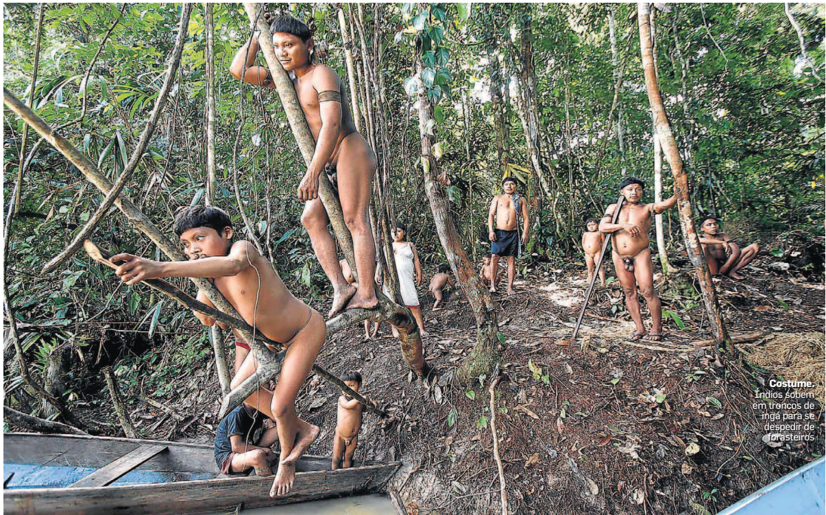
Costume. Índios sobem em troncos de árvore para se despedir de fareleiros