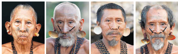
'Felinos'. Matises ganharam apelido pela tradição de fincar espinhos e adornos no rosto e nas orelhas