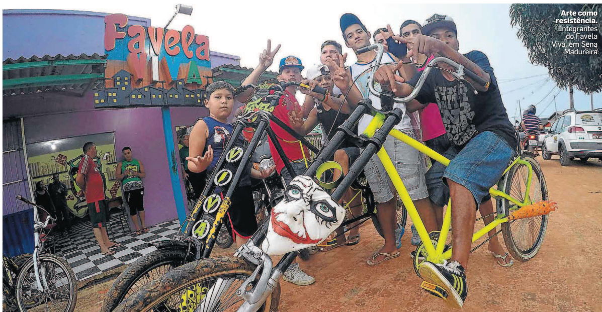
Arte como resistência. Integrantes do Favela Viva, em Sena Madureira